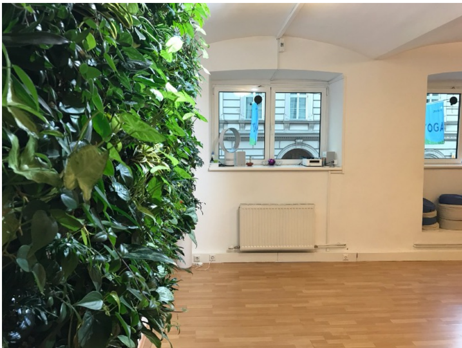
Abb. oben und unten: Der Raum 2 (im 1. Stock) mit unserem 2. Indoor-Dschungel als natürliche Klima-Anlage!