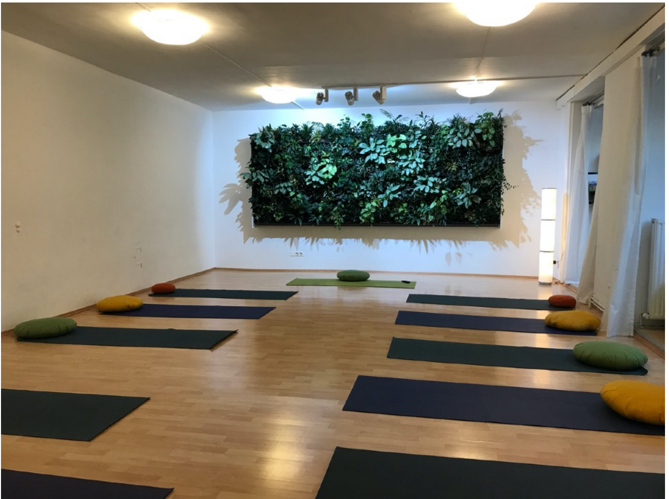
Abb. oben: Blick in den Raum 1 (im Erdgeschoss) mit unserem Indoor-Dschungel als natürliche Klima-Anlage!

Raum 1 - Yoga-Raum im EG: 54 m 2 Nutzfläche, hell und mit Sichtbeziehung zur Liechtensteinstraße (gute Wahrnehmung durch die PassantInnen), Seminarbestuhlung, Flipchart und Beamer auf Wunsch. Stereo-Anlage vorhanden.